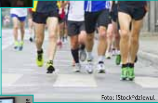
Tag der offenen Betriebe in Lage